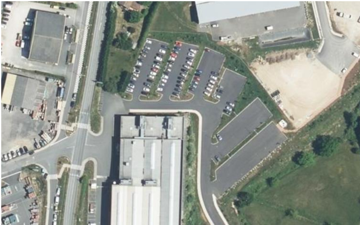
Figure 2 : Photo aérienne du site