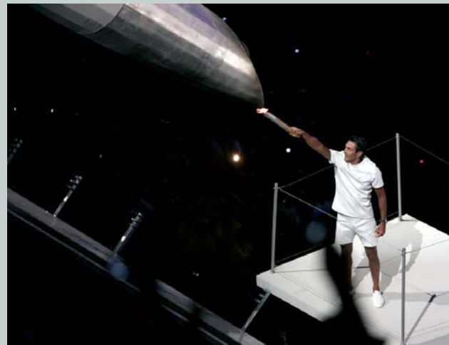
Lors de la cérémonie d'ouverture des Jeux Olympiques d'Athènes 2004 (GRE), Nikolaos Kaklamanakis, le dernier porteur de la flamme olympique allume la vasque du stade olympique.