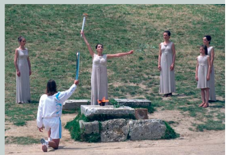
Le premier porteur de la flamme des Jeux Olympiques de Sydney 2000 (AUS).

Quelques mois avant l'ouverture des JO, la flamme est allumée à Olympie (Grèce) devant les ruines du temple d'Héra, à proximité du stade où se déroulaient les Jeux Olympiques de l'Antiquité. Elle est ensuite acheminée par relais jusque dans la ville organisatrice des Jeux, quelque part dans le monde.