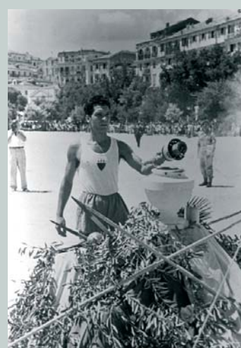
Le relais de la flamme olympique de Londres 1948 (GBR).