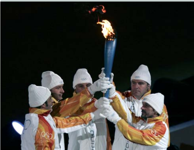
En 2006, lors de la cérémonie d'ouverture des Jeux Olympiques de Turin (ITA), cinq porteurs entrent dans le stade avec la torche. Cette image représente la paix, l'esprit d'équipe et le respect d'autrui qui règnent aussi au cours des épreuves des Jeux.

Illustration : FANTASY DESIGN par Alain & Claude Gellon