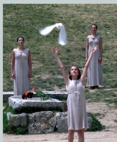
Lâcher de colombe lors de la cérémonie d'allumage de la flamme à Olympie.