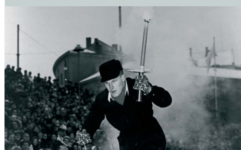
Un relayeur de la flamme des Jeux Olympiques d'hiver d'Oslo 1952 (NOR). A l'occasion de ces Jeux la flamme n'a pas été allumée à Olympie mais à Morgedal, dans le foyer de Sondre Norheim, pionnier du ski moderne.