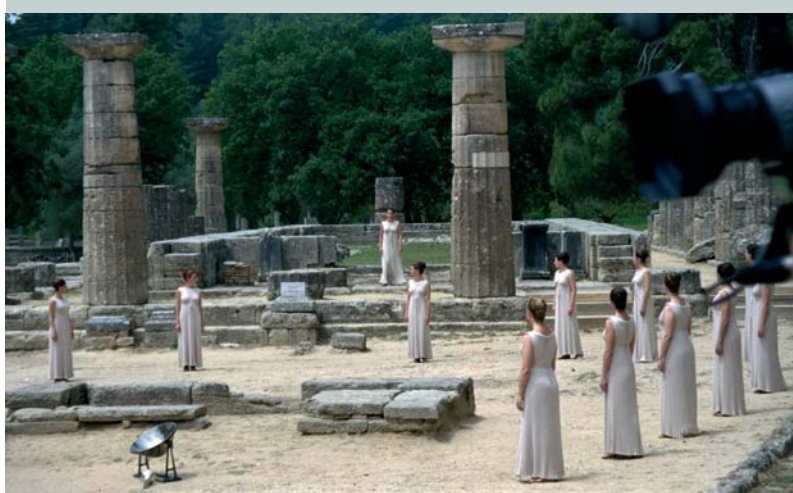
Les prêtresses dans le temple d'Héra.