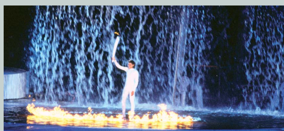
Dernière relayeuse, l'australienne Cathy Freeman, d'origine aborigène allume la vasque du stade olympique lors de la cérémonie d'ouverture des Jeux Olympiques de Sydney 2000 (AUS).