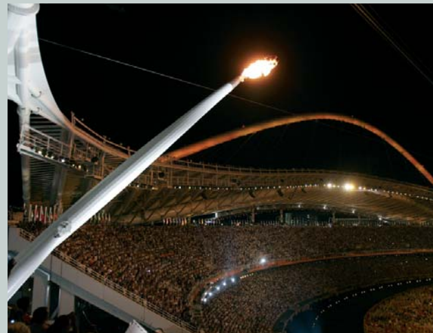
La flamme olympique brûlera dans la vasque du stade olympique pendant toute la durée des Jeux. Ici, il s'agit de la vasque des Jeux Olympiques d'Athènes 2004 (GRE).