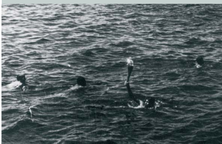
Dans l'eau, un nageur assure un relais de la flamme olympique des Jeux Olympiques de Mexico 1968 (MEX).