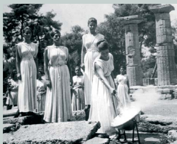
Les vestales captent les rayons du soleil pour allumer la flamme olympique.