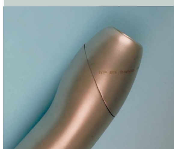
La torche des Jeux Olympiques d'hiver d'Albertville 1992 (FRA).