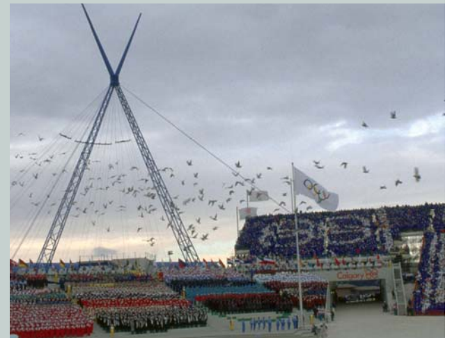
Cérémonie d'ouverture des Jeux Olympiques de Calgary 1988 (CAN). Deux autres symboles olympiques : le drapeau et la colombe.

Connaissez-vous les anneaux, la devise et la flamme olympique ? Ces symboles véhiculent les valeurs de l'Olympisme. Ils confèrent une identité aux Jeux et au Mouvement olympiques.