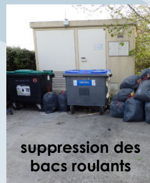
suppression des bacs roulants